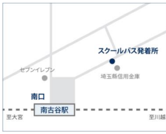
●JR 川越（埼京）線 南古谷駅南口

改札を出て左に進み、東口の階段を降りて、左方向にロータリーに沿って進む。ロータリーの出口付近。