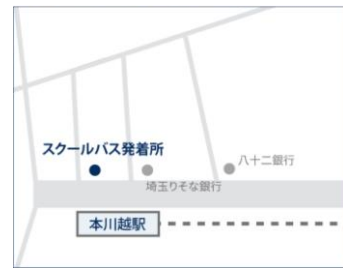
●西武新宿線 本川越駅前