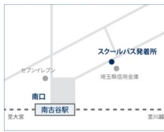
●JR川越（埼京）線 南古谷駅南口

改札を出て左に進み、東口の階段を降りて、左方向にロータリーに沿って進む。ロータリーの出口付近。