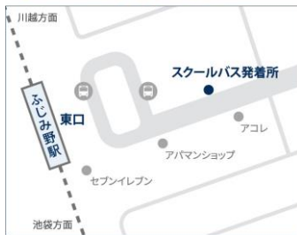
●東武東上線 ふじみ野駅東口

改札を出て左に進み、東口の階段を降りて、左方向にロータリーに沿って進む。ロータリーの出口付近。