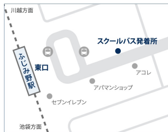
●東武東上線 ふじみ野駅東口

改札を出て左に進み、東口の階段を降りて、左方向にロータリーに沿って進む。ロータリーの出口付近。